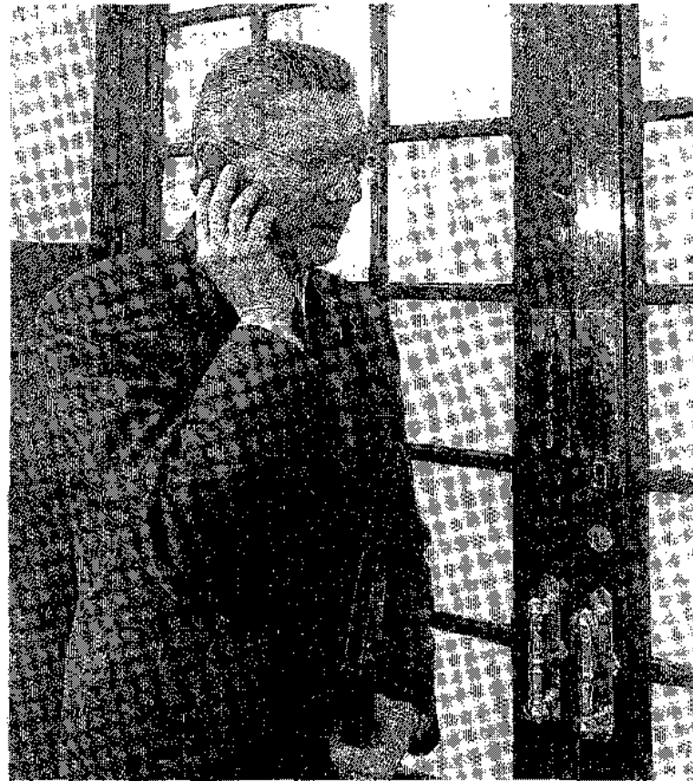
Alberto Ruiz-Gallardón, ayer, en el Congreso.

Al mismo tiempo, lamentaron que el ministro ignore el clamor popular que suponen las 350.000 firmas presentadas por los ciudadanos