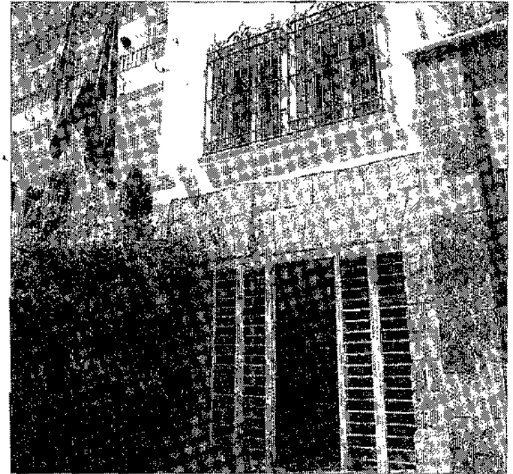
INGRESOS. Edificio del Colegio de Abogados de Jaén.