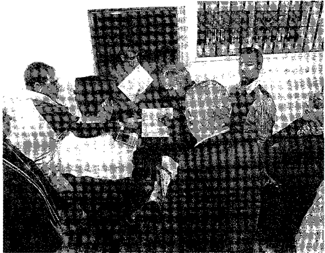
Ejecución de un desahucio en una imagen de archivo.

En la Oficina, las familias en riesgo de desahucio tienen a su disposición a entre 20 y 30 abogados especialistas en la materia (y que no prestan servicio jurídico a ninguna entidad bancaria). A las familias que aún no han dejado de pagar sus hipotecas, pero que temen verse en esa circunstancia, se les asesora sobre las consecuencias que tiene el