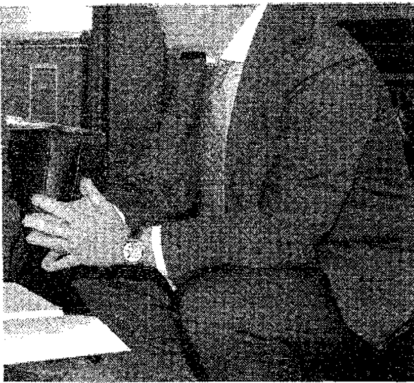
e de la Junta el pasado mes de octubre. VIVA JAÉN

estructura extraordinaria e importante y demandar por la sociedad jienense es la Ciudad Sanitaria; creación de mucho empleo proyectos como Bogaris,