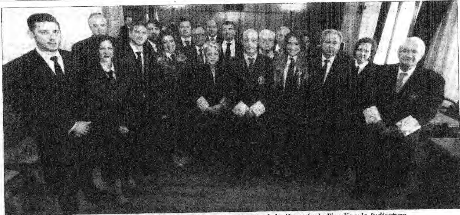
FOTO DE FAMILIA. Los nuevos colegiados, junto a sus padrinos y representantes de la Abogacía, la Fiscalía y la Judicatura.