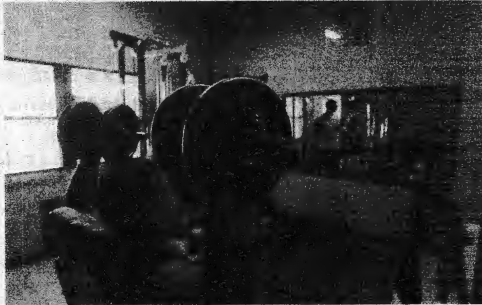
Internos de la prisión de Jaén en una imagen de hace un par de años.

¿Por qué se dejó de financiar el servicio? Desde 2008 el SOAJP se financiaba con un convenio a tres bandas: Ministerio de Justicia y Junta podían el dinero. Los colegios de abogados ponían el personal y organizaban los turnos. «La Consejería