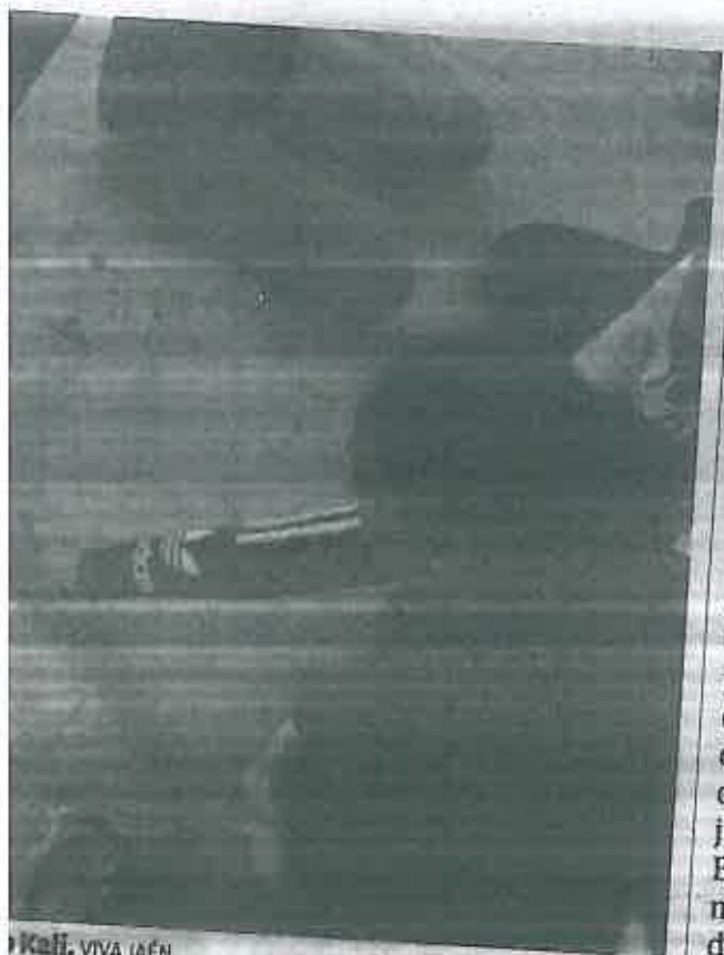
Kali. VIVA JAÉN

asociaciones Sinando Kalí, de Capital, Linares, Úbeda y Andújar