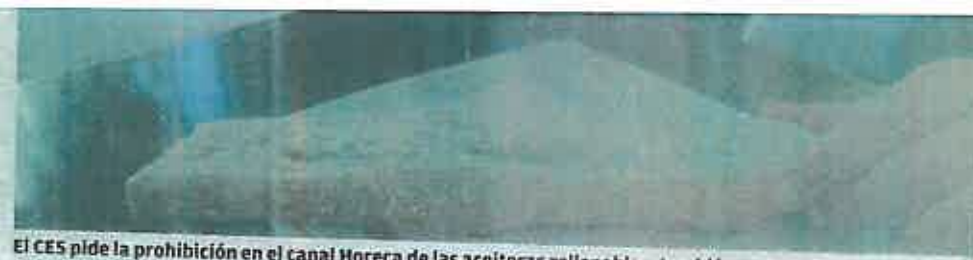
El CES pide la prohibición en el canal Horeca de las aceiteras rellenables, también en Europa. VIVA JAÉN

tenecientes al mismo Asaja, UPA, COAG y Cooperativas Agro-Alimentarias, al presidente del Consejo Económico y Social Europeo, a la ministra de Agricultura, Alimentación y