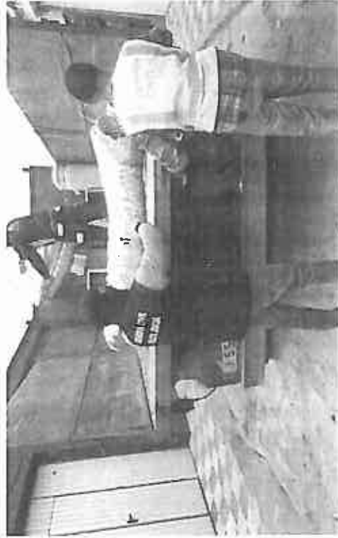
Los agentes se llevan las instalaciones para las plantas. :: e. civil

Según ha informado la Guardia Civil, en el operativo intervinieron ayer una treintena de agentes. Hicieron cuatro registros domiciliarios de forma simultánea, en los que además de las plantaciones se inter-