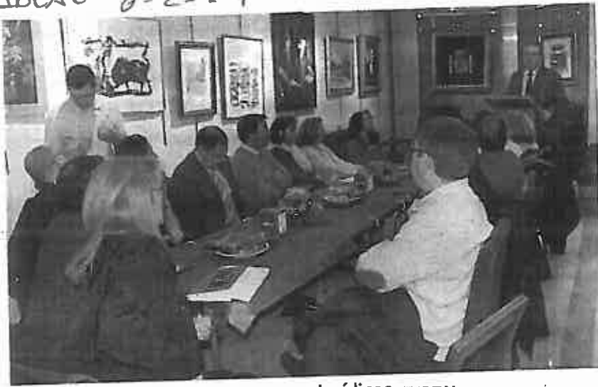
Imagen de la iniciativa Desayunos Jurídicos.