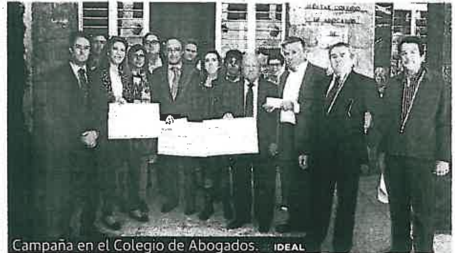
Campana en el Colegio de Abogados. IDEAL

go de un año con un euro mensual adicional a su cuota para que, posteriormente, sea destinado a fines solidarios. Casi todos los colegiados jienenses han aceptado participar en la iniciativa, cuyos fondos serán entregados a diversas ONG de la provincia de Jaén. En las cuatro ediciones del Euro Solidario ya realizadas, los letrados han aportado una cantidad económica muy significativa, que ha sido entregada a entidades con fines sociales.