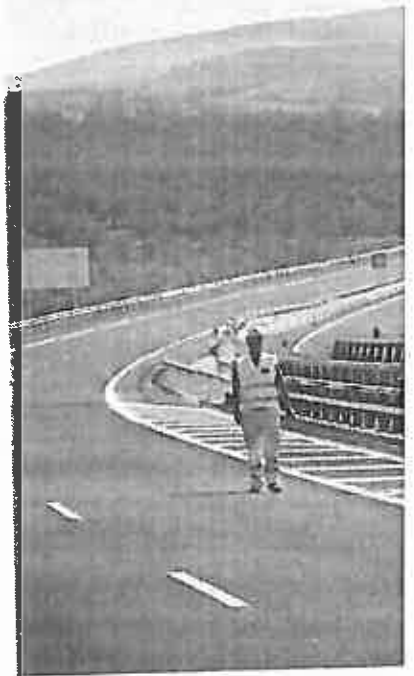
Vista del tramo de la A32 entre