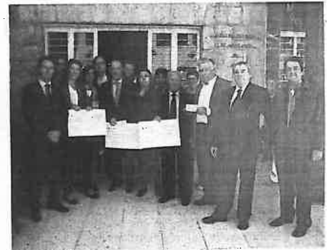
Entrega del cheque en una anterior edición.

Oya, explica que la campaña está enmarcada en las acciones de Responsabilidad Social Corporativa del Colegio y se muestra "muy orgulloso" de la generosidad mostrada por el colectivo de los abogados jienenses. "Queremos poner nuestro granito de arena desde el colectivo de la Abogacía para apoyar la magnífica labor que realizan estas entidades con los jienenses que necesitan más apoyo", manifiesta.