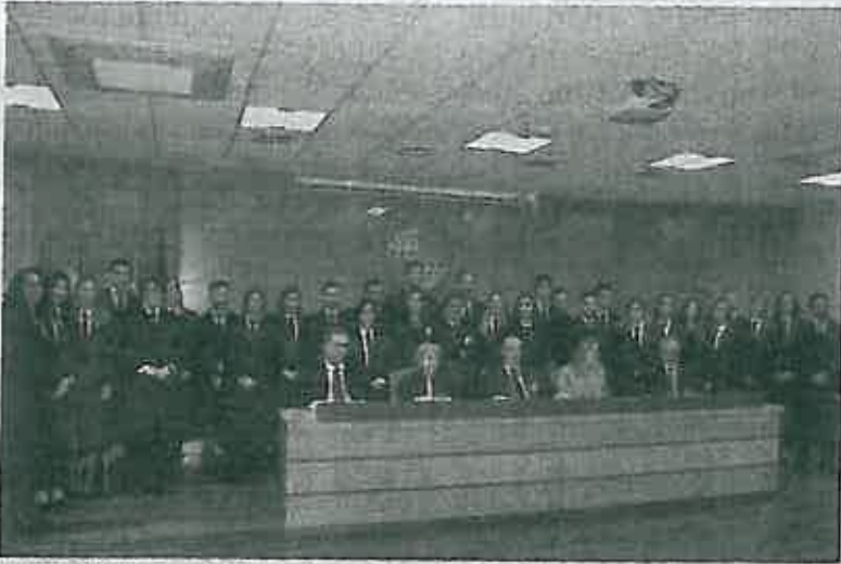
Nuevos letrados del Colegio de Abogados de Jaén. VIVA JAÉN