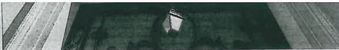
PALACIO DE JUSTICIA. Fachada principal de la sede de la Audiencia Provincial de Jaén.