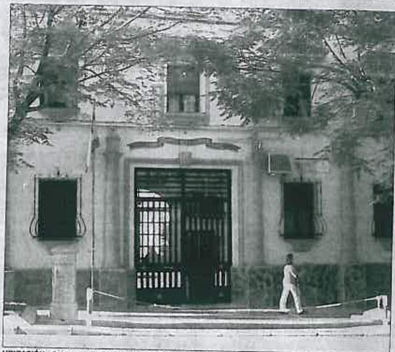
UBICACIÓN. Entrada a las instalaciones de la Comandancia de la Guardia Civil en la capital.

Según declaraciones oficiales de la Guardia Civil, el teniente coronel de Jaén estaba molesto porque