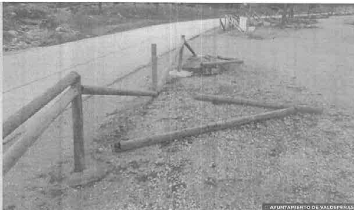
AYUNTAMIENTO DE VALDEPEÑAS

JAÉN. «Uno de los esfuerzos de conservación más exitosos del mundo». Así anuncia la prestigiosa cadena BBC el documental que emitirá mañana a las ocho de la tarde en la BBC One, con el que concluye su serie 'Big Cats'. El proyecto transnacional para la recuperación de la distribución histórica del lince ibérico, 'Life+Iberlince', copará el protagonismo, que también tendrá Sierra Morena y la provincia de Jaén en general, donde están más de la mitad de los ejemplares que existen del felino autóctono de la península. El censo de la población de lince ibérico que vive en libertad en la península correspondiente al 2017 cifra en 547 los ejemplares que viven en Andalucía, Castilla-La Mancha, Extremadura y Portugal, cuando en 2002 eran 94.