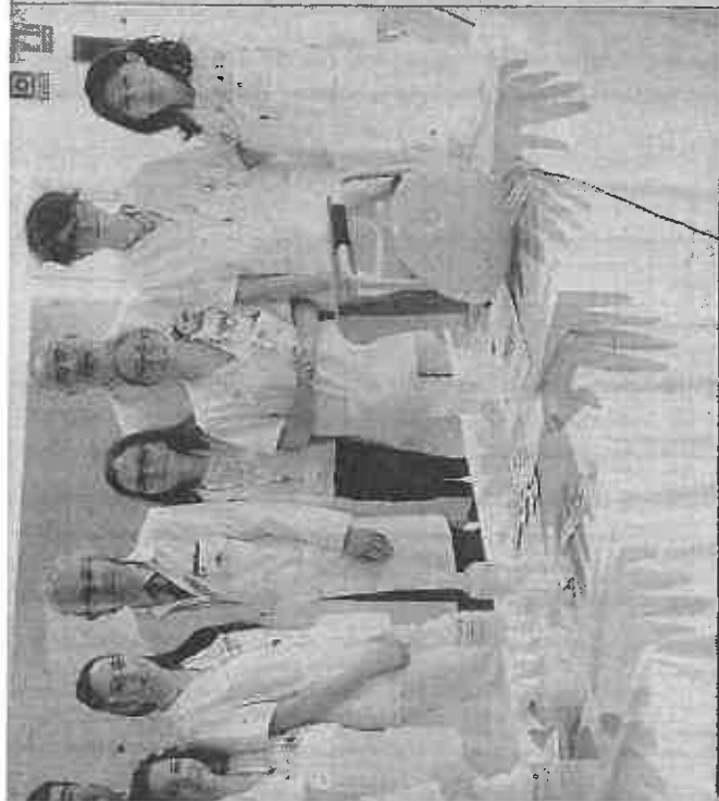
Analés sanitarios junto a una de las mesas informativas del hospital.