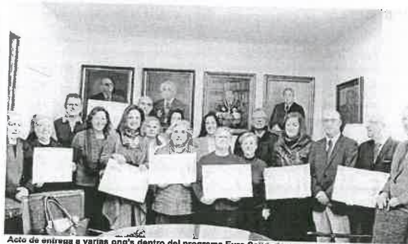
Acto de entrega a varias ong's dentro del programa Euro Solidario. local

Seis años después de su creación, esta oficina ha ido adaptándose a las necesidades de un mundo cambiante. A la asistencia destinada a personas que se encuentran en riesgo por impago de la hipoteca se han sumado otros servi-