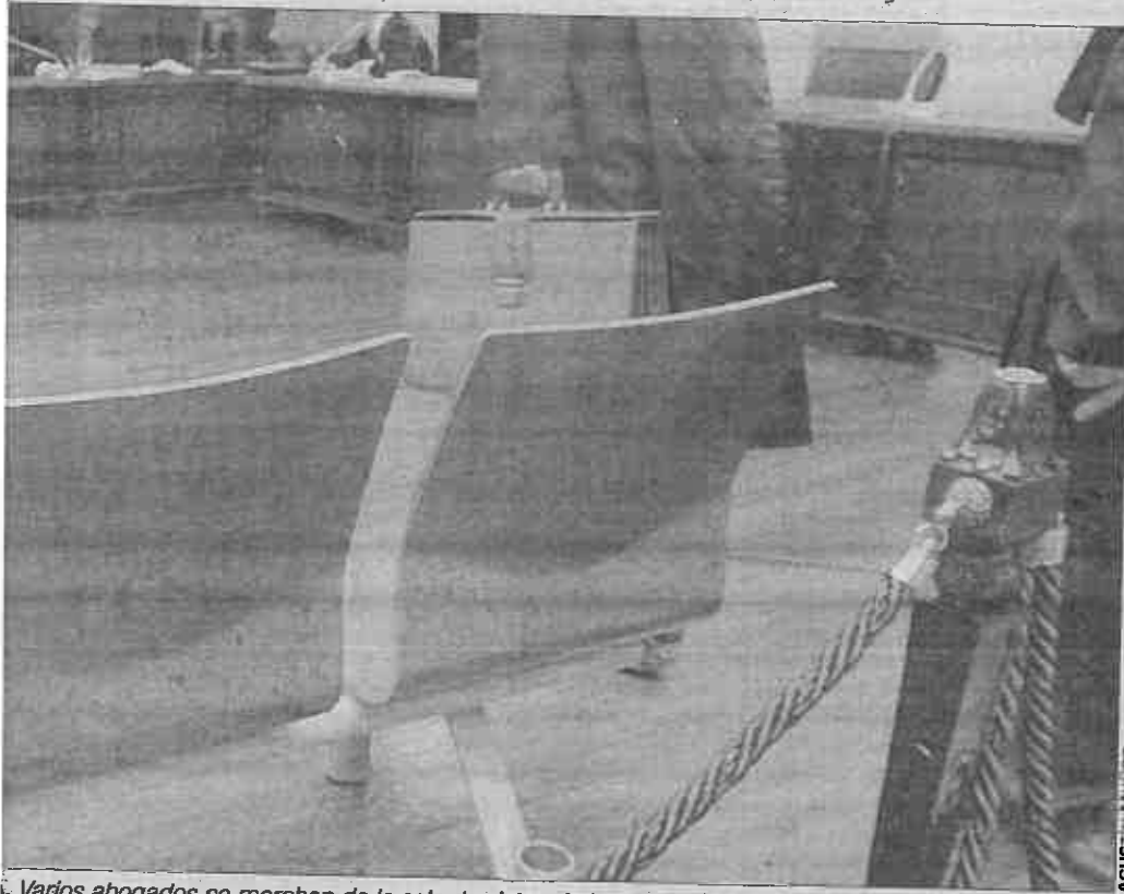
Varios abogados se marchan de la sala de vistas de la Audiencia tras un juicio.

"Corrupción" se querrela contra un letrado jiennense