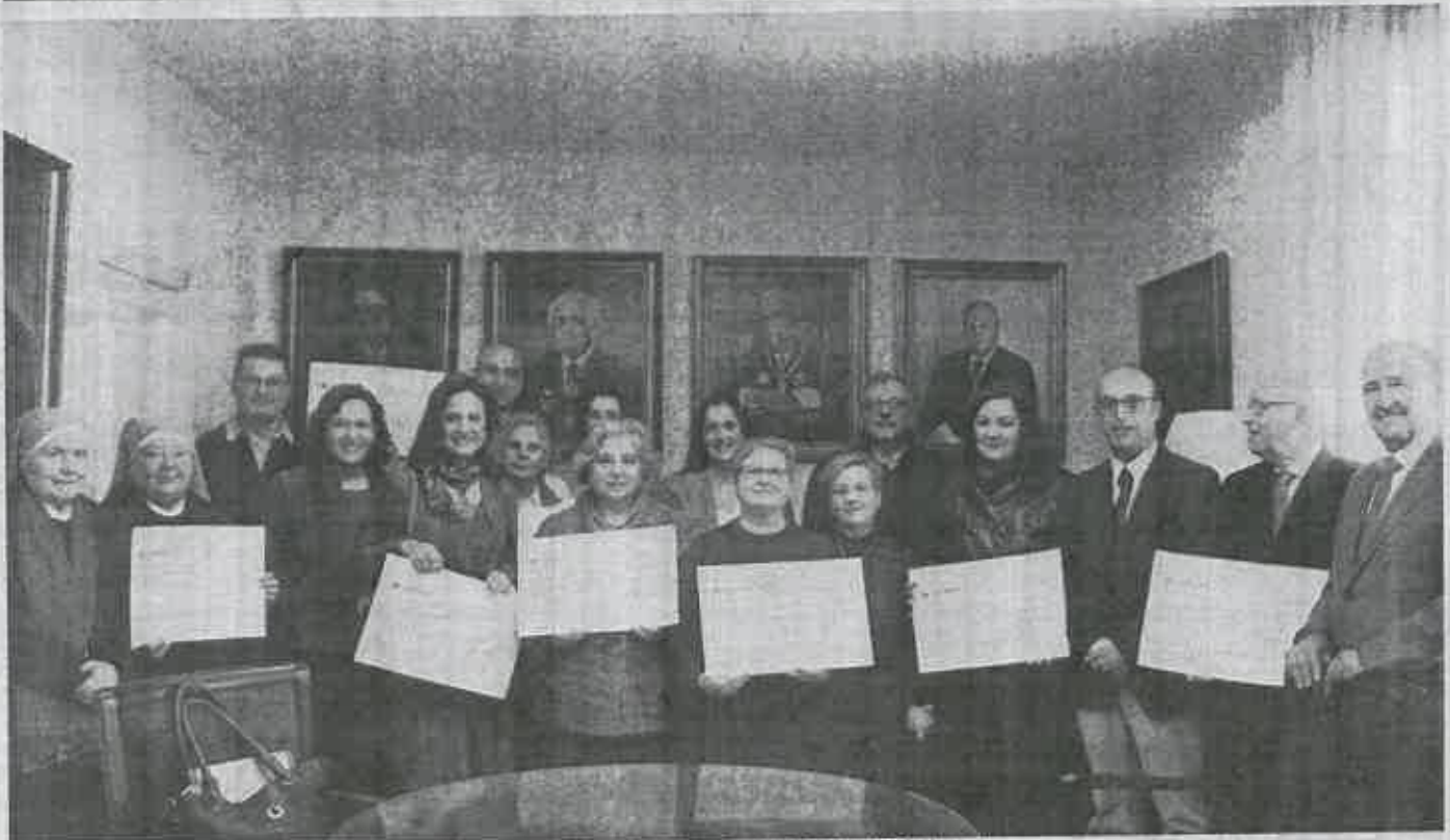
Diferentes asociaciones y Oficinas beneficiarias de la iniciativa "Euro Solidario" que puso en marcha hace cinco años el Colegio de Abogados de Jaén. VIVA JAÉN