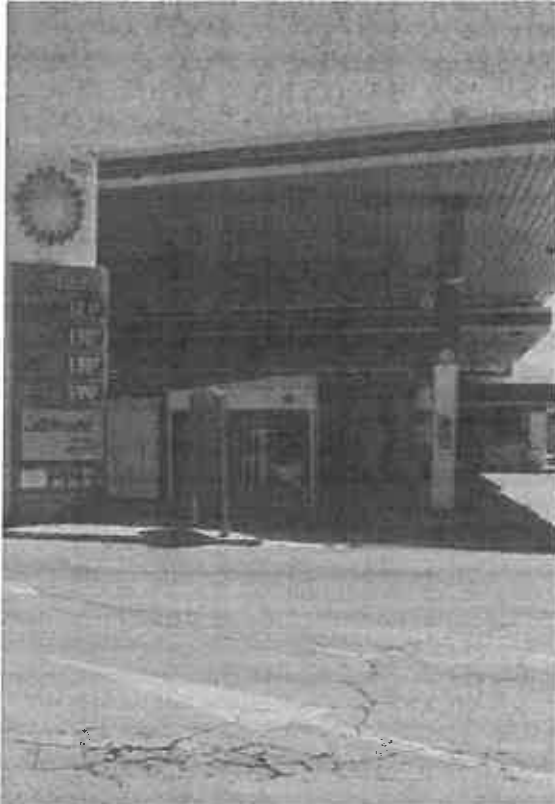
madrugada. VIVA JAÉN

ituación. an Afán, de e Empresa- o, de los Oli- confirmó la que se está ltimos días, no conse- andas itine- entes, y re- ntemente se ente el pro- elegada del España en a Molina,